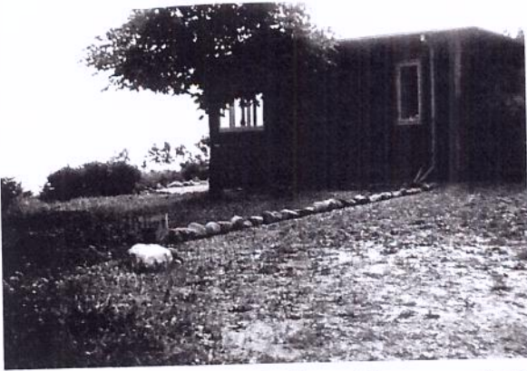
"Det skønneste sted på jorden," som Ellens mor udbrød om "Svalereden."

takkede nej til købet. Det skal her med, at den lille hest fra jumpen græssede på et stykke eng imedens. Denne eng blev senere mit elskede sted, og ved gravning fandt jeg en halv hestesko; hvem ved om den tilhørte den lille hest fra jumpen?