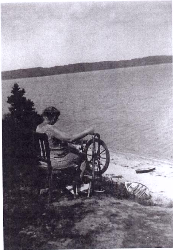
Fru Drotten har taget rokken med ud på Lille Klit.

og svigerdatter. Det fortælles, at hun kun havde tilladt sin søn at bygge købmandsforretningen, hvis de ikke trådte i hendes grønkal.