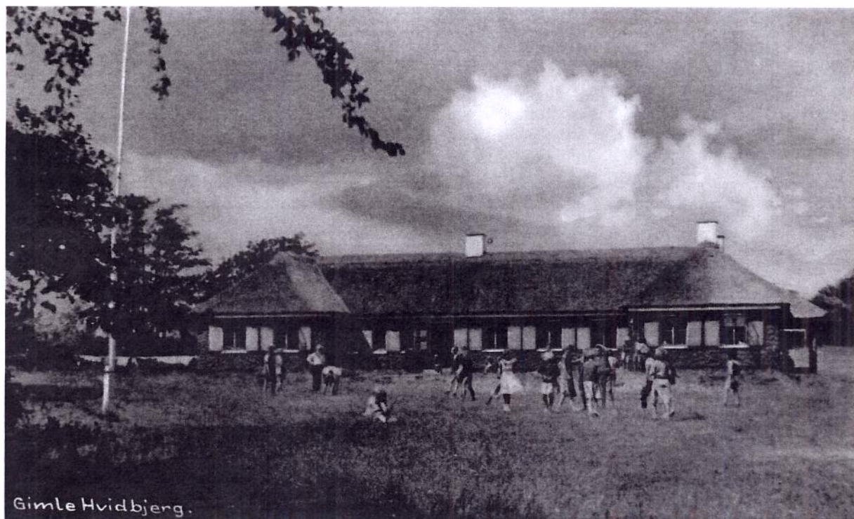
"Gimle," Hvidbjerg.

mine øjne den smukkeste landsbykirke, jeg kender. Som 9-årig blev jeg så betaget af dens store røde tårn, at jeg udbrød: "Der vil jeg konfirmeres," og da jeg holdt på mit, fik jeg min vilje. Jeg tog to gange om ugen med rutebilen til præst, som det hed. Undervisningen foregik i Pastor Fonsbøls spisestue; vi var kun 15 konfirmander, det foregik ved vintertid, for der var ikke konfirmation om efteråret. Da havde man ikke tid på landet, for børnene skulle hjælpe i marken, om efteråret tage kartofler op og hjælpe med høsten.